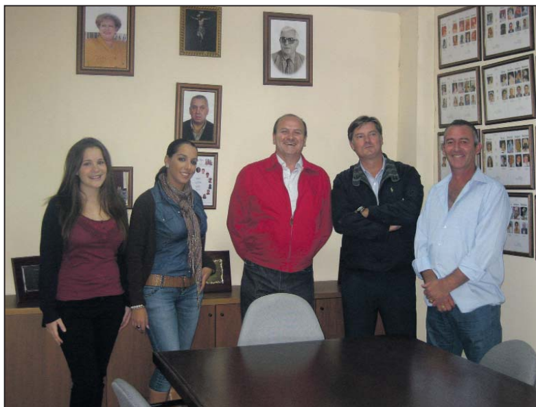
Almuerzo de la proclamación de los Reyes Magos de la cabalgata de 2011. Se celebró el día 31 de octubre en la nave de la asociación Amigos de los Reyes Magos

las Artes. Por otro lado, el miércoles 22 a las 19:00 horas, el Teatro Municipal acogerá la actuación de un Coro de Campanilleros. La entrada es gratuita.