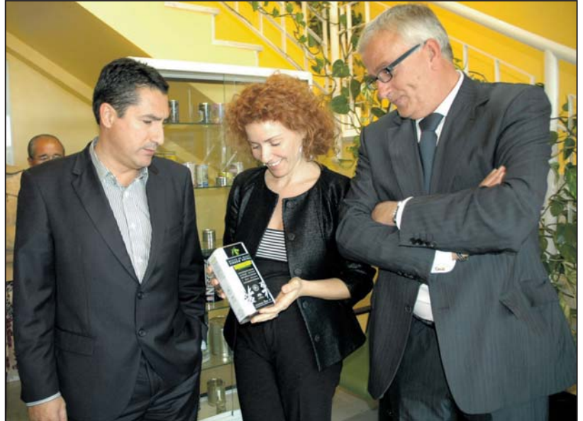
La delegada y el alcalde de Mairena con el director general de la empresa Auxiliar Conservera

Hasta el momento adquieren sus envases desde la factoría que posee el grupo empresarial en Murcia. No obstante, uno de los objetivos inmediatos que se marca la empresa es traerse hasta esta factoría sevillana toda la producción que vaya a ser vendida a clientes de Sevilla entre los que se encuentran empresas tan importantes como Hojiblanca, Ángel Camacho, Aceitunas Guadalquivir y Agrosevilla Aceitunas, entre otros. La empresa facturó el pasado año 130 millones de euros, 30 de los cuales se contabilizaron en Sevilla.