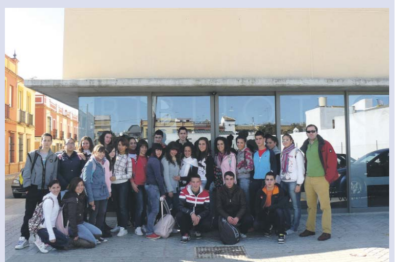
La Biblioteca Pública José Manuel Lara celebró desde el día 22 al 25 de noviembre la Semana de la Interculturalidad, coincidiendo con el tercer aniversario desde que se inaugurasen las nuevas instalaciones.

reño, que también respondió a la audiencia. Todo no es escuchar. El programa, además, invita a participar a la audiencia para intercambiar puntos de vista y compartir experiencias. El número de teléfono de la radio pública de Mairena es el 95 509 30 30.