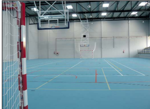
En la parte superior de la imagen, detalle del sistema de iluminación

Todo ello posibilita una iluminación sostenible y muy rentable, al mantener apagada la iluminación eléctrica durante muchas horas al día. La luz natural puede sustituir a la luz artificial durante más del 70% de las horas del día. Este novedoso sistema se incorporará