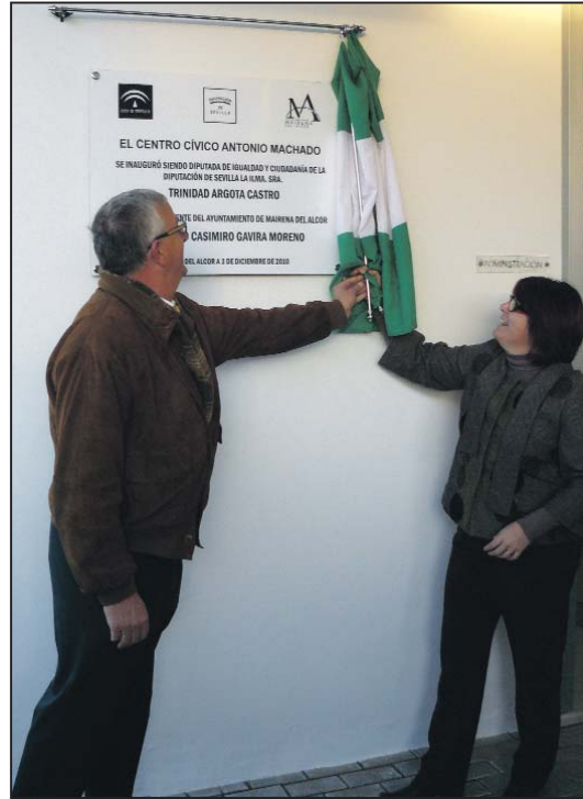
El alcalde y la diputada provincial recorren la cortina de la placa conmemorativa

El alcalde ha destacado la importancia de desarrollar en los jóvenes el lenguaje musical