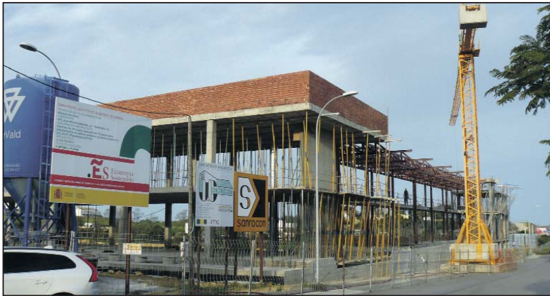
Estado actual de las obras de construcción del centro de especialidades médicas

En los últimos meses, el Gobierno Municipal ha emprendido importantes políticas en materia de Salud de las que ya disfrutaban los ciudadanos, como el acuerdo con la delegación provincial para que las farmacias ofrezcan el servicio de guardia nocturna los siete días de la semana y las mejoras en el centro de salud.