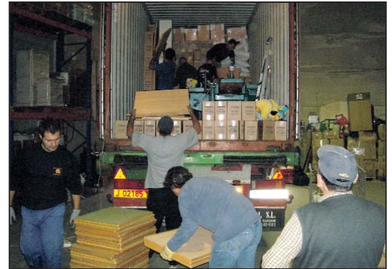
Voluntarios de Llamarada de Fuego cargando la ayuda humanitaria

Los hospitales rurales de Kapiri, Mtengo wa Nthenga, Mlale, Ludis y Mtendere, el orfanato de Chezi y los centros de formación de Chipaso y Área 49 de la república de Malawi, en el sureste de África, han recibido recientemente 20.720 kilogramos de artículos fundamentales para el día a día de la ONG local Llamarada de Fuego. Los artículos, en su mayoría, proceden de donaciones particulares. No obstante, cabe destacar la colaboración de la administración pública y algunas compras realizadas por Llamarada. En esta ocasión, el contenedor de 79 metros cúbicos de capacidad iba cargado con