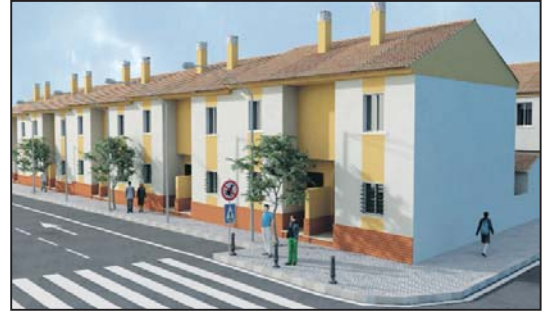
Recreación de las VPO que se construirán en la barriada de El Patriarca

presas locales dedicadas a la construcción, es además, un balón de oxígeno para las pequeñas empresas locales de diversos sectores relacionados con la vivienda: muebles, electrodomésticos, cocinas, electricidad, fontanería, car-