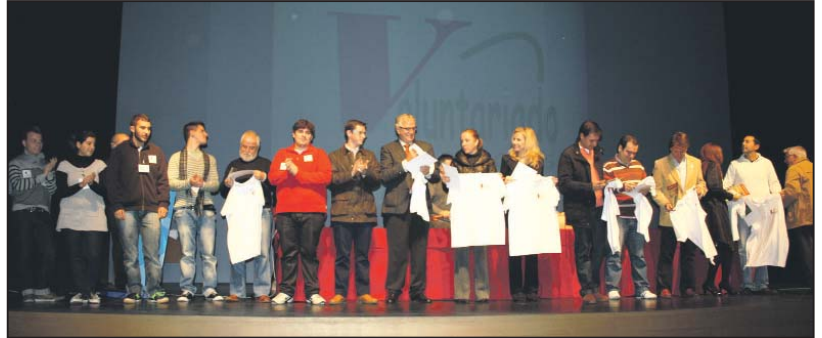
El Teatro de la Villa del Conocimiento y las Artes fue la sede del II Congreso comarcal de Voluntariado Los Alcores

los voluntarios de los cuatro municipios. El Congreso ha sido satisfactoriamente valorado por los máximos representantes políticos de Mairena y El Viso del Alcor, así como por la Directora General de Voluntariado y Participación de la Junta de Andalucía, Rosario Ayala.