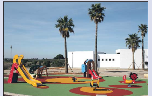
Atracción infantil en el Parque Norte, cuyo acceso principal se encuentra en la calle Villaverde

negocio se basa en la simplificación y máxima eficiencia en todos los procesos de la organización con el objetivo de ofrecer a sus clientes la mejor calidad al mejor precio.