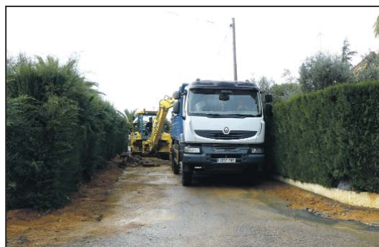
Maquinaria en plena faena en la urbanización El Rosal