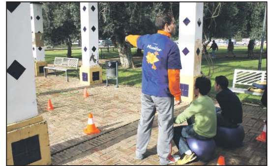
Gymkana en el parque de la Villa del Conocimiento y las Artes