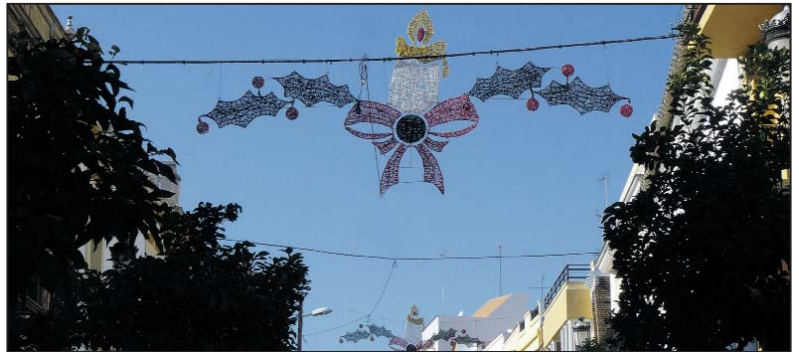
Arcos luminosos de la Navidad 2009/2010

Las luces navideñas permanecerán encendidas desde el 17 de diciembre hasta el Día de Reyes