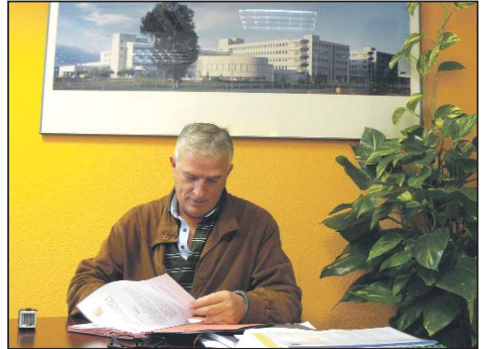
El alcalde firmando el convenio

Esta fase está dotada con 3.497.867,30 euros millones de euros de inversión. El siguiente paso es la redacción del pliego de condiciones de licitación. Las obras de la primera fase, correspondientes al área administrativa, empezaron el día 19 de julio con la colocación de la primera piedra en el solar donde se ubica el centro sanitario, entre la Avenida de El Viso del Alcor esquina con la calle El Pedroso, en Mairena del Alcor. La operación ha sido financiada al 50% por el