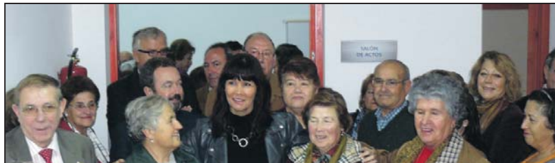
Un grupo de usuarias recibieron calurosamente a la consejera a su llegada

El Centro de Servicios Sociales Comunitarios constituye el primer nivel de asistencia pública, para orientar y buscar soluciones a las necesidades sociales. Entre los recursos más demandados, se encuentran los relacionados con la dependencia, la infancia, las familias y la atención a las drogodependencias y adicciones.