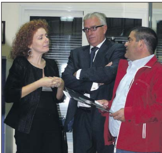
Visita a la empresa local Capitas S.L.