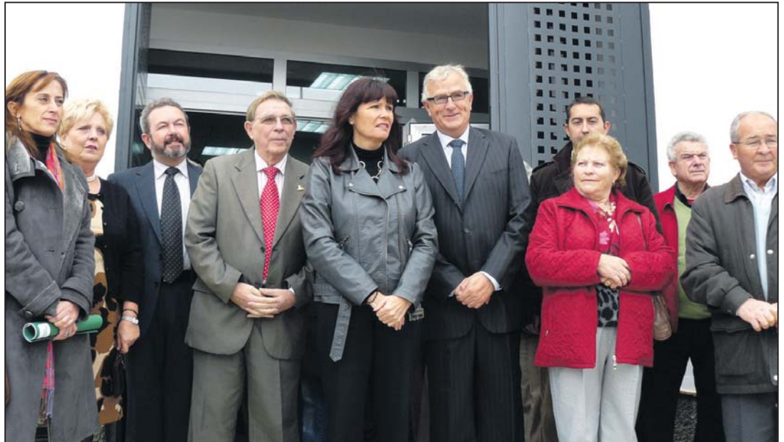
En el centro, de izquierda a derecha, la consejera y el alcalde de Mairena del Alcor

En la planta semisótano se ubica la sala de reuniones, un salón de usos múltiples, un archivo y otros seis despachos para la asesora jurí-