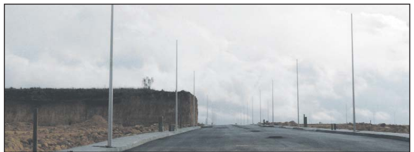
Las obras de ampliación del polígono marchan en los plazos previstos

Dirigidas a la pequeña y mediana empresa, las naves industriales que en este proyecto se instalen contarán con todo el apoyo del Ayuntamiento mairenero, que es propietario de casi la tercera parte del suelo disponible, y