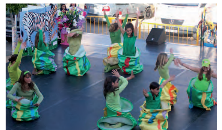
Alumnas de uno de los talleres de la Casa de la Cultura representando a una Serpiente en la XI Fiesta de la Primavera