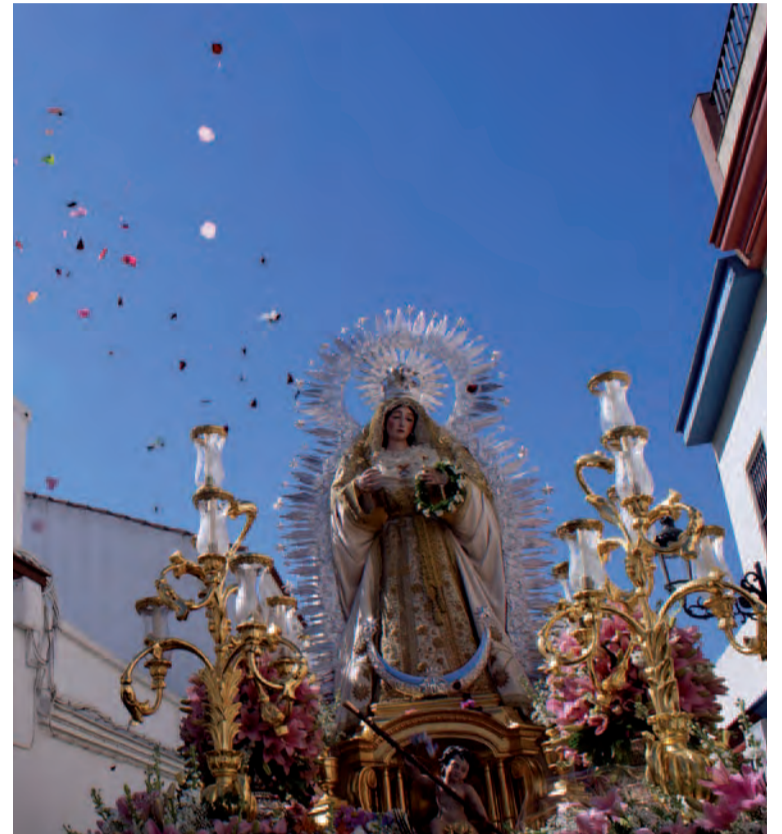
Una de las petaladas que recibió la Virgen de la Estrella.

La Semana Santa de Valencina llegó a su fin con la Procesión de Gloria de Nuestra Señora de la Estrella, imagen titular de la Hermandad de Torrijos.