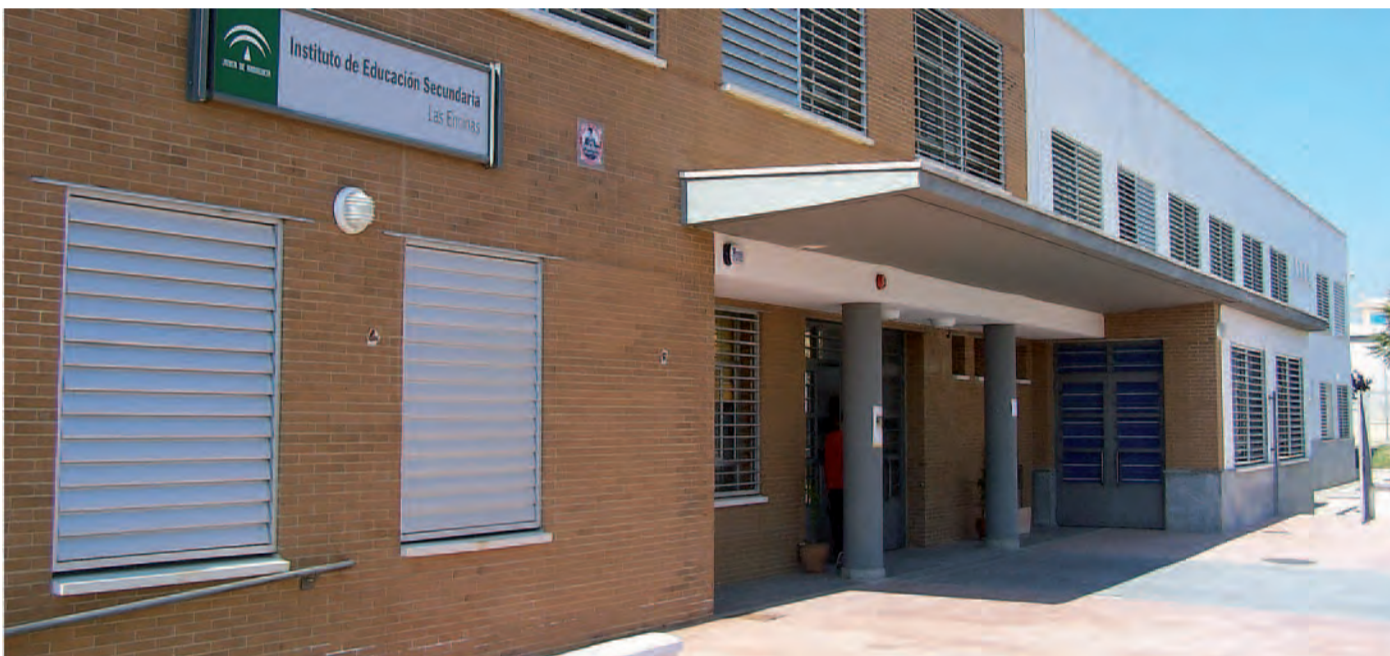
Imagen actual del IES Las Encinas