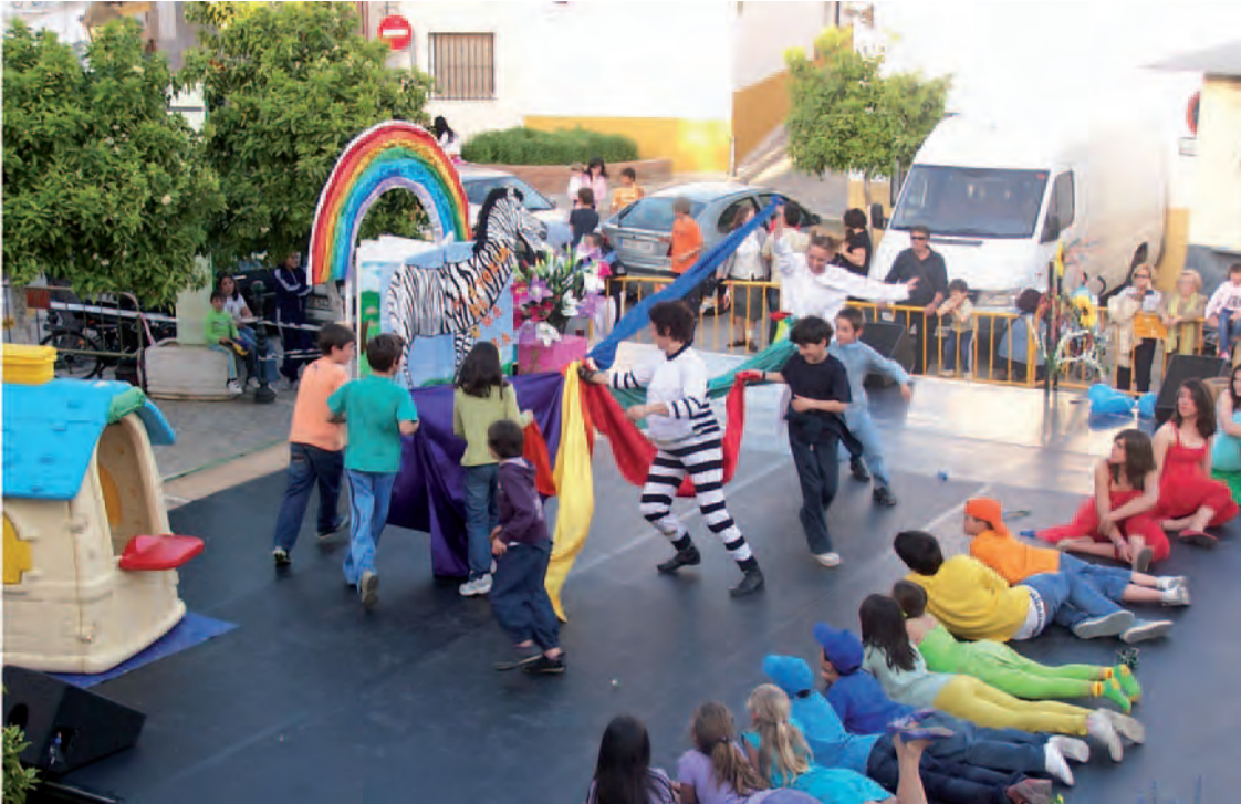
Representación del Cuento "Historia de una Cebra"