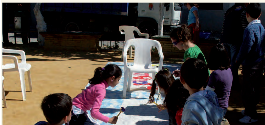
Una de las actividades conmemorativas del 8 de Marzo