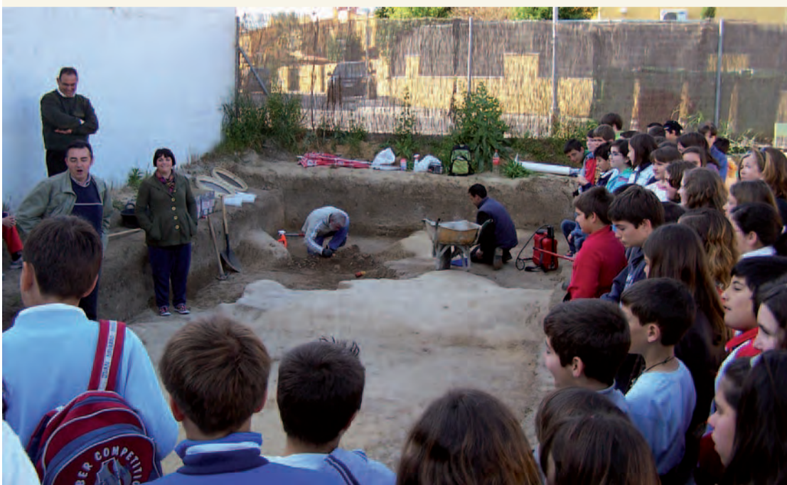
Momento de la visita a la excavación

Los alumnos y alumnas de los grupos de Sexto de Primaria del CEIP Algarrobillo de Valencia realizaron una Jornada Arqueológica, organizada por la delegación de de Cultura y Patrimonio del Ayuntamiento de Valencia, que comenzó con una visita guiada a una excavación arqueológica real, pudiendo contemplar, entre otros elementos hallados, parte de los cimientos de una cabaña prehistórica.