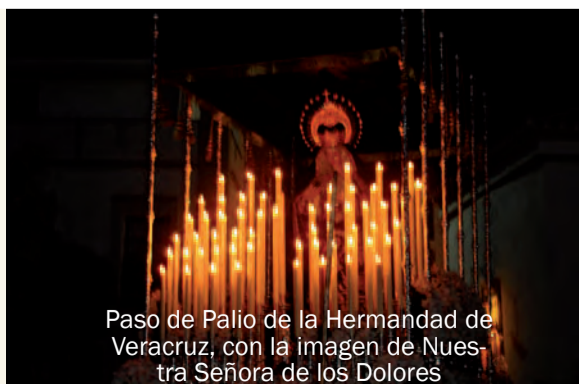
Paso de Palio de la Hermandad de Veracruz, con la imagen de Nuestra Señora de los Dolores