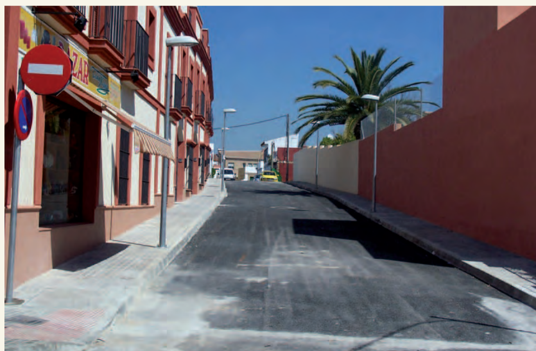
Imagen de la calle Félix Rodríguez de la Fuente, actualmente abierta a la circulación de vehículos

IBI URBANA. IBI RÚSTICA. IMPUESTO SOBRE VEHÍCULOS DE TRACCIÓN MECÁNICA (IVTM). Más información: OPAEF (Diputación de Sevilla). Teléfonos 901 500 105. www.opaef.es