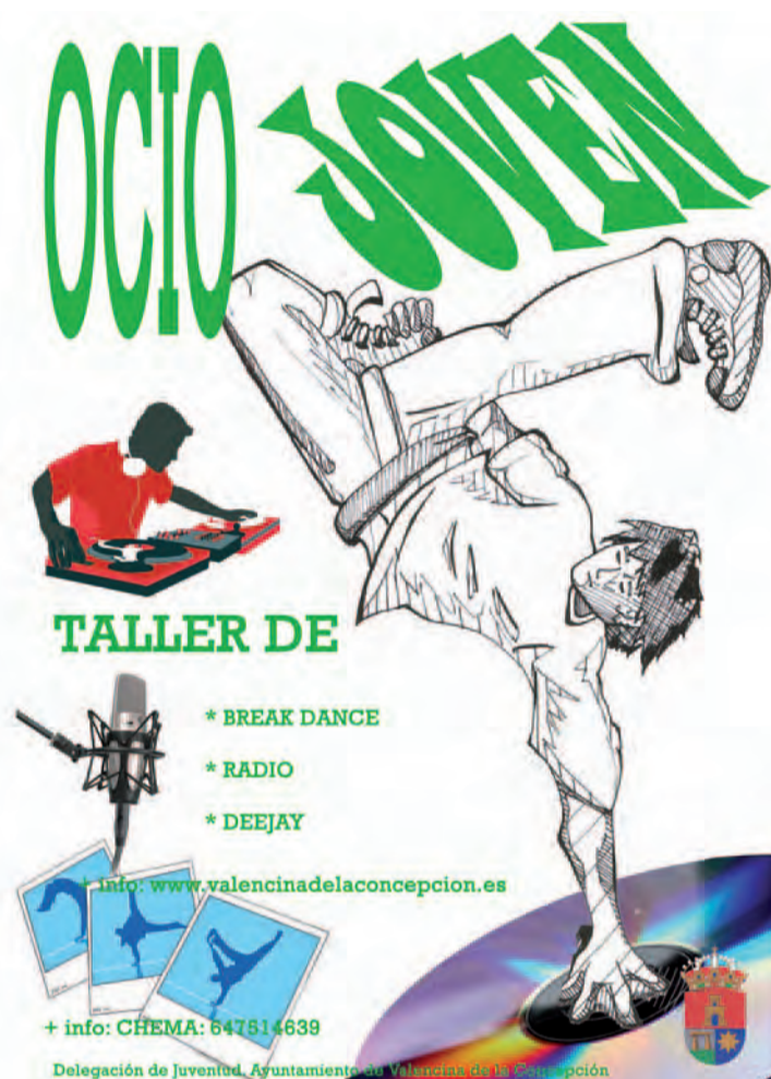
Cartel de los Talleres de Juventud

Para ello, aprenderán técnicas de vocalización y entonación, realizarán prácticas en los estudios centrales de Onda Valencia Radio, y también aprenderán a diferen-