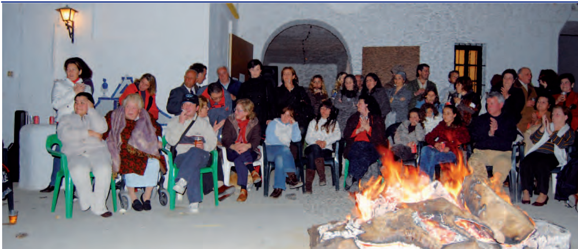
Uno de los actos celebrados en conmemoración del Día de Andalucía, la "Candelá Flamenca", en la Hacienda Tilly.