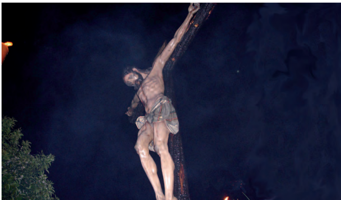
Nuestra Señora de Los Dolores, en su salida en Estación de Penitencia.

juventud, cuenta con una larga trayectoria en cuadrillas de capataces y costaleros. Otros estrenos dignos de destacar son el de la vestimenta de los servidores de la Cruz de Guía, la nueva Reliquia de San Francisco, que estuvo situada en la delantera del paso de Cristo; y por otra parte, en el Palió, se estrenaría los varales, los faroles de cola, la Saya y el Rosario de la Virgen, y una imagen de la Virgen de la Inmaculada, situada en la entrecalle de la candelaría.