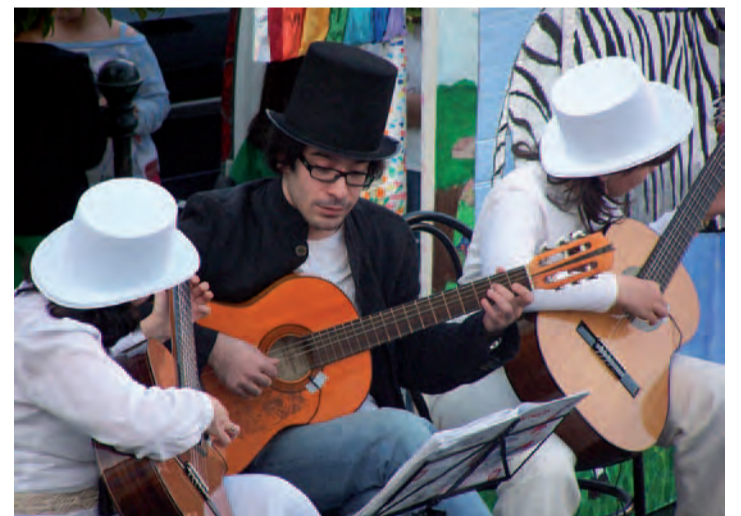
Alumnos de la Escuela de Música, en un momento de la actuación

Se incorporan todos los talleres, mostrando cada uno sus particularidades un verdadero montaje escénico dando protagonismo a unos 145 participantes