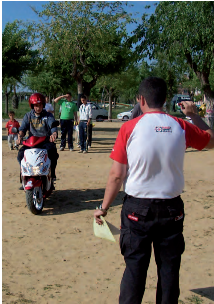
Encuentro de Ribete, en Valencia

Los jóvenes de Ribete de Valencia partici-