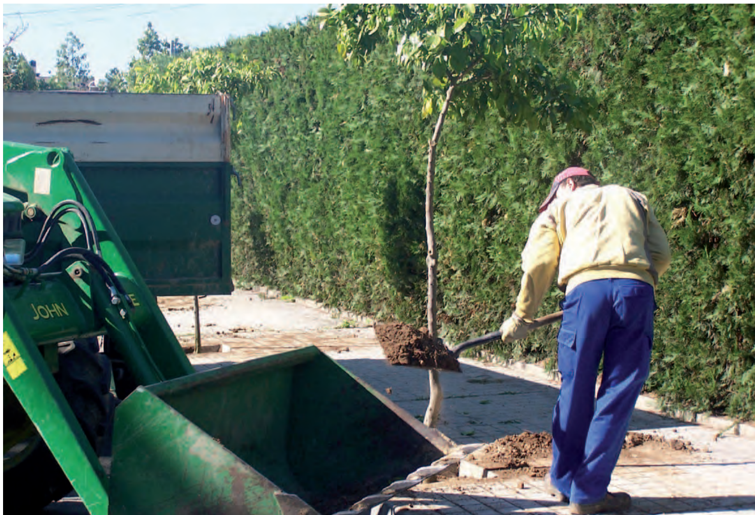
Trabajo de plantación de naranjos

La delegación Parques y Jardines de Valencina de la Concepción ha comenzado los trabajos de mejora del arbolado mediante la plantación de naranjos agrios en la calle prolongación