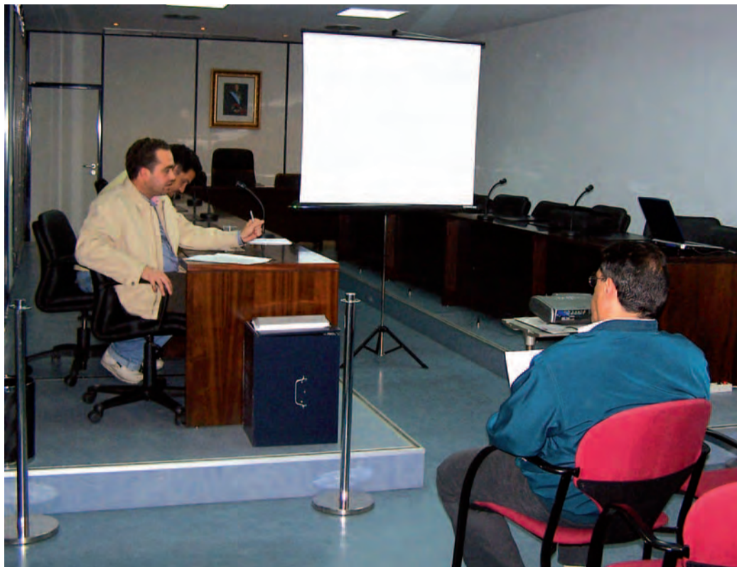
Presentación del Fondo Estatal de Inversión Local a empresarios de Valencia