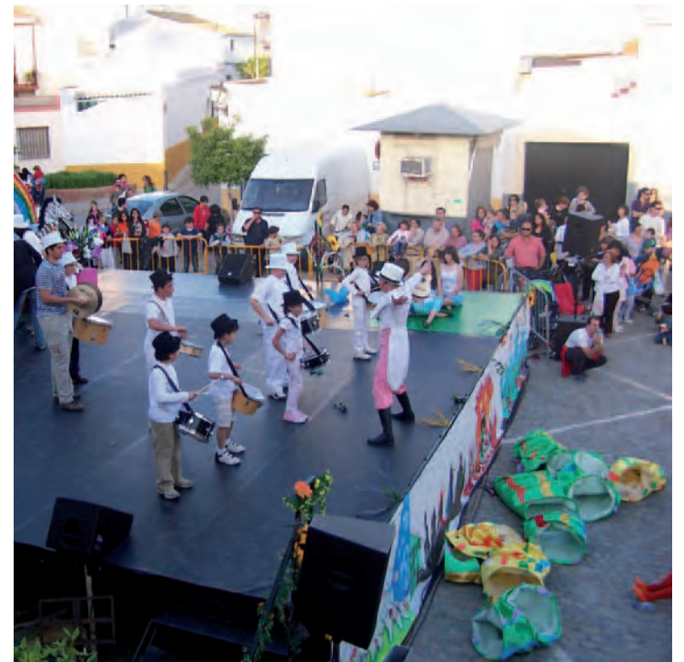
Actuación de uno de los talleres de la Casa de la Cultura