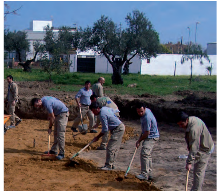
Alumnos del Taller de Empleo, realizando trabajos en el Parque

Los alumnos del Taller son los encargados de construir el Parque Mata-rubilla