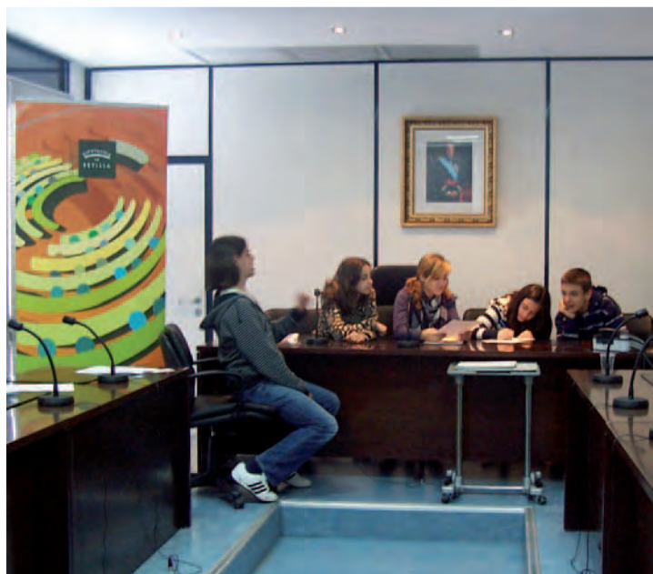
Tercera Edición del Parlamento Joven 2009

En el programa participan una quincena de alumnos del IES Las Encinas.