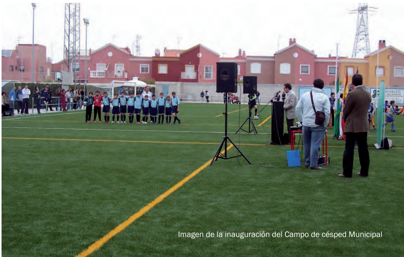
Imagen de la inauguración del Campo de césped Municipal

Un campo de fútbol de césped artificial y dos pistas de pádel amplía la oferta deportiva del Polideportivo Municipal Diego de Paz Pazo Pág 2-3